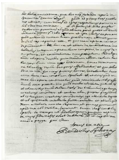
Afbeelding 3 Brieffragment van Spinoza. Universiteitsbibliotheek Groningen.

verhoudingen. Het bijzondere is nu dat Spinoza al deze op het oog negatieve factoren – verbeelding, emoties, bijgeloof – niet veroordeelt of verwerpt. Nee, omdat ze voortvloeien uit de specifieke aard van de mens en de plaats die deze inneemt in de totale ordening van de natuur, zijn ze als alle andere dingen in de natuur noodzakelijk en dus ook niet goed of slecht. Wel is het zo dat de enige mogelijkheid tot menselijk geluk is gelegen in het verder ontwikkelen van de rede, het vermogen tot begrip. Een toenemende kennis van de natuurwetten en van onze plaats in de natuur als geheel zal ons in staat stellen onze mogelijkheden optimaal te gebruiken en ons bij onze beperkingen neer te leggen. Spinoza spreekt van ‘de allerhoogste voldoening en gemoedsrust’ die voortkomen uit het bewustzijn dat alles ‘geschiedt door de kracht van een hoogst volmaakte zijnde en volgens zijn onveranderlijk besluit.’ Dit samenvallen van inzicht en geluk heet bij Spinoza de ‘verstandelijke liefde tot God’, amor intellectualis Dei . Omdat deze vorm van liefde echter moeilijk te bereiken is en zeker niet voor iedereen is weggelegd, zullen ook de verbeelding en de hartstochten altijd een belangrijke rol blijven spelen in onze pogingen gelukkig te worden – en dat moet ook wel, want ze maken deel uit van onze natuurlijke gesteldheid.